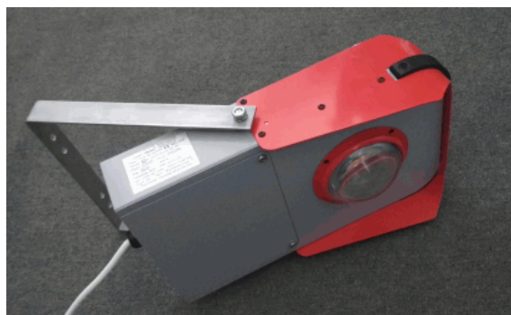
FLY-Ex 42EOc változat

A lámpatestek majdnem teljes egészében újrahasznosítható anyagokból épülnek fel.